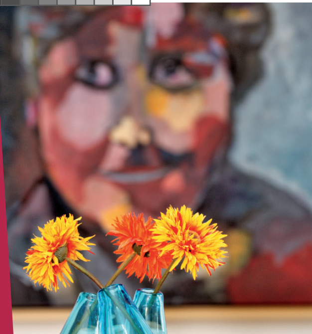
Agnes Neuhaus, Gründerin des Sozialdienstes katholischer Frauen e.V.