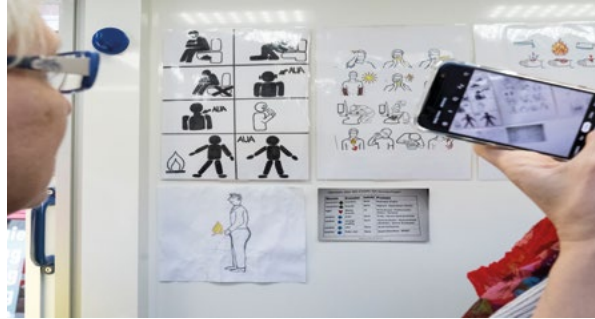
Ein Blick ins Krankenmobil der Caritas Hamburg. Zu sehen sind Erklär-/Zeigetafeln für beispielsweise Menschen, die sich nicht oder nur schwer mit Sprache verständigen können

Alle Gefahren, Risiken und Probleme, mit denen wohnungs- und obdachlose Menschen zu kämpfen haben, treffen erschwert auch auf Menschen mit Behinderungen zu. Bislang fehlt es jedoch an einer systematischen wissenschaftlichen Analyse des Themas Wohnungslosigkeit und Behinderung . Hier zeigt sich eine Forschungslücke, die dringend geschlossen werden muss. Denn nur auf der Grundlage empirischer Daten lassen sich pass-