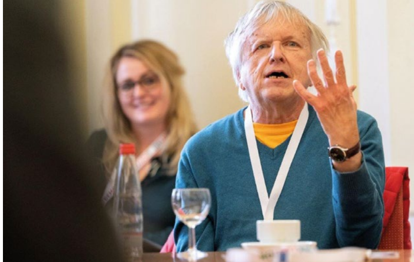
Willi Jakob von Einfach Heidelberg e. V. berichtet von den digitalen Projekten auf dem inklusiven Nachrichtenportal www.einfach-heidelberg.de

freiheit ist die Grundlage für die umfassende Information und Teilhabe aller Bürger*innen – egal ob mit oder ohne Behinderungen. Für öffentliche Stellen sind das Behindertengleichstellungsgesetz und die Barrierefreie-Informationstechnik-Verordnung (BITV 2.0) mittlerweile eindeutig: Sie sind verpflichtet, ihre digitalen Angebote barrierefrei zu gestalten.